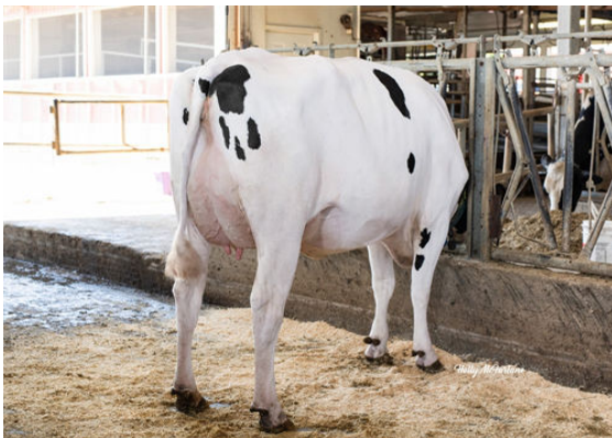
FB LULU ACHV VEGAS DAM